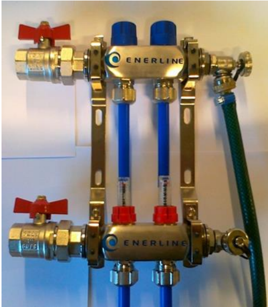
Kuva 6. Veden juoksutus

8. Sulje ilmauspäädyn venttiili ja poista letku (kuva 7).