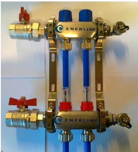
Kuva 2. Menupuolen venttiili auki ja paluupuolen venttiili kiinni