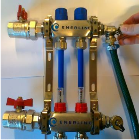
Kuva 2.1. Ilmausletku kytkettynä ilmauspäättyyn

3. Kytke ilmausletku paluupuolen ilmauspäättyyn (kuva 3).