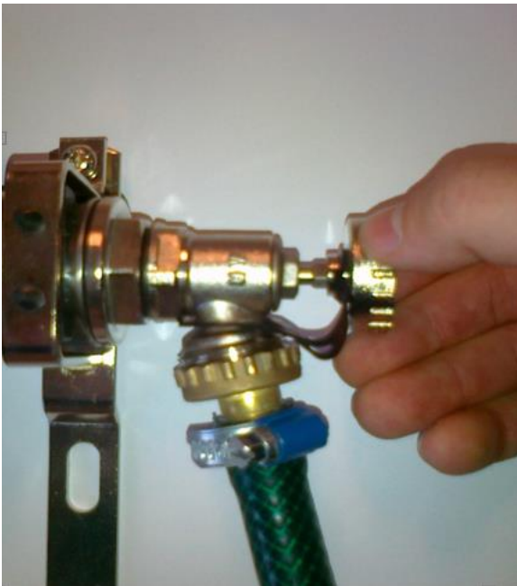
Kuva 3. Ilmauspäädyn venttiilin avaus

4. Avaa ilmauspäädyn venttiili korkissa olevalla avaimella (kuva 3).