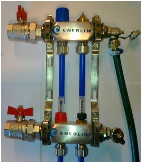
Kuva 5. Veden juoksutus

6. Sulje molemmat venttiilit ja toista kohdan 5. toimenpide seuraavalle piirille, kunnes kaikki piirit ovat ilmattu (kuva 5)