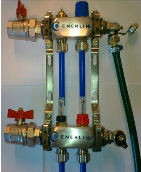
Kuva 4. Veden juoksutus

5. Avaa ilmattavan piirin tulo- ja paluuventtiili. Anna veden virrata piirin läpi, kunnes kaikki ilma on poistunut (kuva 4).